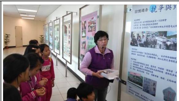
廠區導覽人員導覽