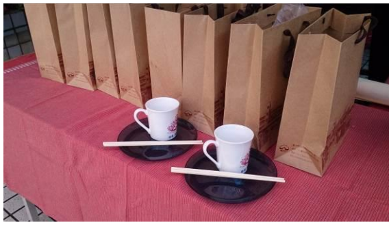
現場備有餐具租用