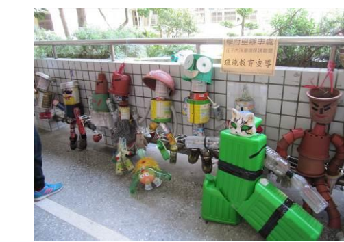
配合里長辦公室宣導環境教育議題