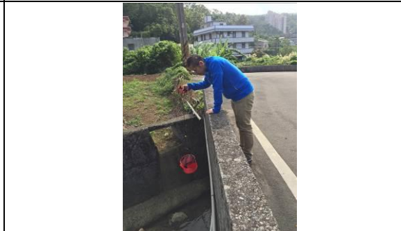
教師踏查學校附近自然環境(水的採集)