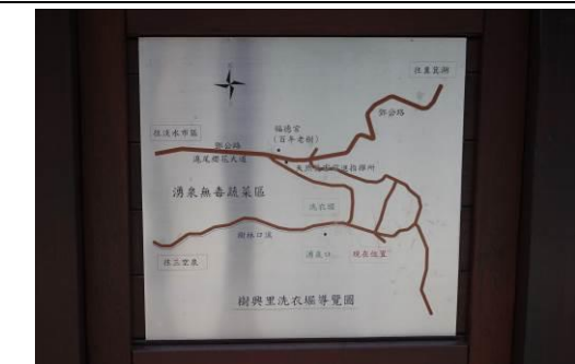
教師踏查學校附近自然環境