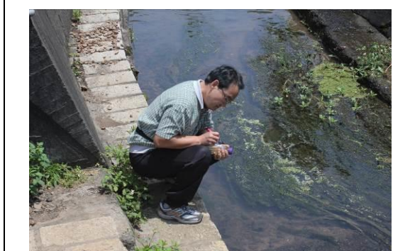
教師踏查學校附近自然環境(水的採集)