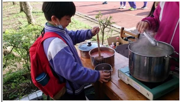
學生自備環保餐具