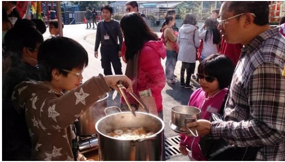
家長自備環保餐具